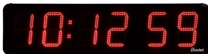
Horloge Heure Minute Seconde