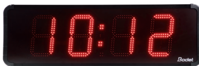
Horloge Heure Minute - Date - Température