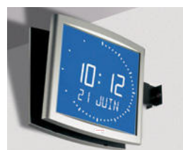
Opalys Ellipse sur support double face