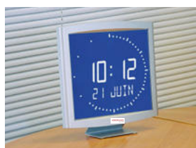
Opalys Ellipse sur support de table